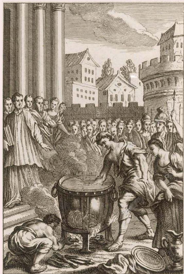
Epreuve de l'Eau bouillante

ORDALIES : l'épreuve de l'eau bouillante pour déterminer la culpabilité de l'accusé.